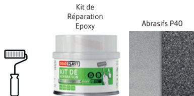
Kit de Réparation Epoxy